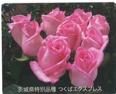
茨城県特別品種 つくばエクスプレス