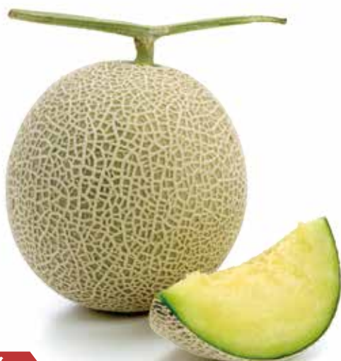
A B アールス