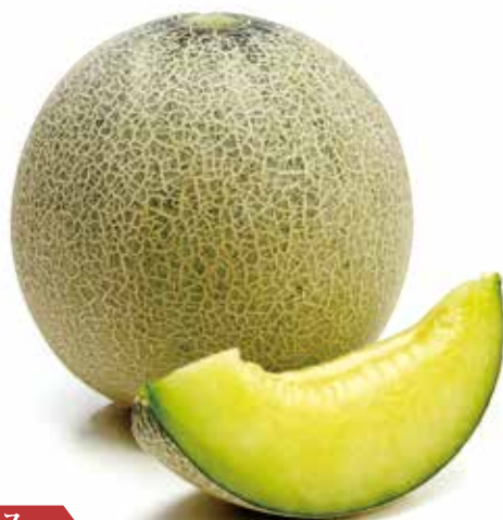
A B アンデス

春の一番最初にできるメロン。適度に柔らかく、果汁たっぷり。すっきりとした甘味があり、風味に富んでいます。