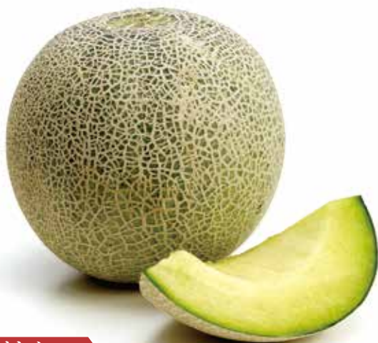
A C オトメ