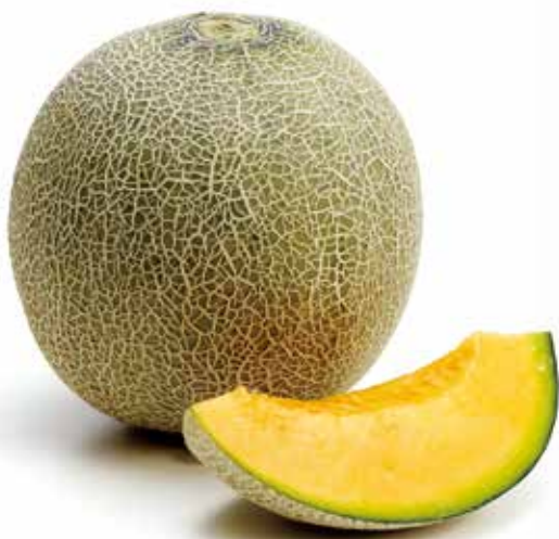
A B クインシー