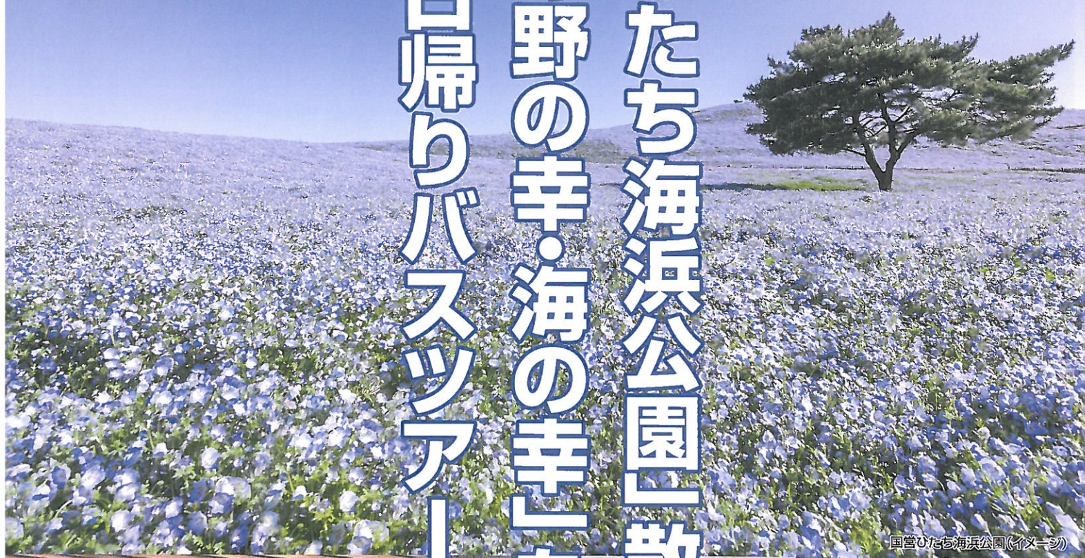
国営ひたち海浜公園(イメージ)